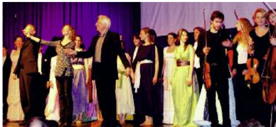
汉堡音乐学院音乐会演出圆满成功