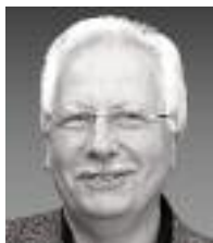
Eberhard Müller-Arp 教授